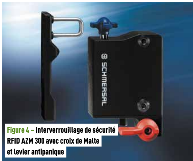
Figure 4 - Interverrouillage de sécurité RFID AZM 300 avec croix de Malte et levier antipanique

Il est essentiel de prendre en compte l'arrêt du mouvement dangereux en cas d'urgence, la maintenance et la recherche de pannes. Dans le cas de zones dangereuses accessibles, l'installation d'un système de déverrouillage de secours (levier, bouton ou poignée antipanique) permettra au personnel accidentellement enfermé de quitter la zone immédiatement et facilement.