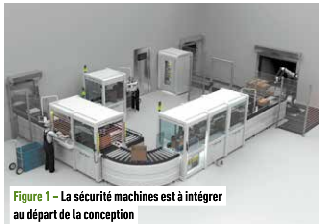
Figure 1 - La sécurité machines est à intégrer au départ de la conception

La sécurisation de zones et points dangereux est pour tout concepteur une activité « classique » des plus exigeantes. Schmersal propose son mémento des sept points clé à prendre en compte pour réussir la mise en conformité des machines.