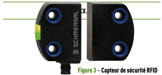
Figure 3 – Capteur de sécurité RFID avec plusieurs niveaux de codage

De nouveaux dispositifs adoptent enfin un design et principe de fonctionnement innovants pour un usage plus étendu et convivial comme l'interverrouillage AZM 300 RFID avec une croix de Malte (voir figure 4).