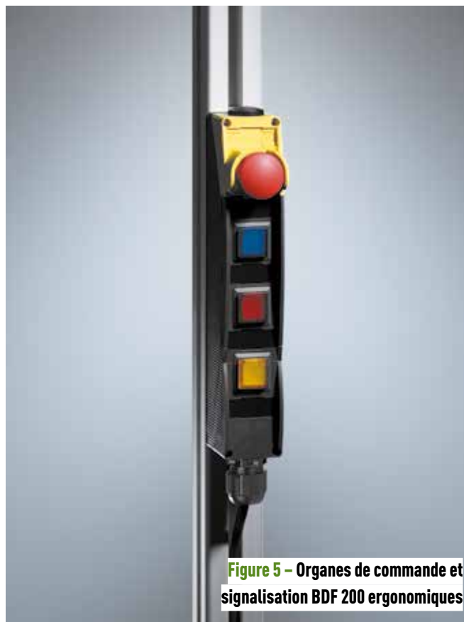
Figure 5 - Organes de commande et signalisation BDF 200 ergonomiques

En complément, il est possible de commander ou de télécharger les documents suivants mis à la disposition des utilisateurs : documentations et brochures produits, sans oublier les services de formation et de conseils sur mesure. ●